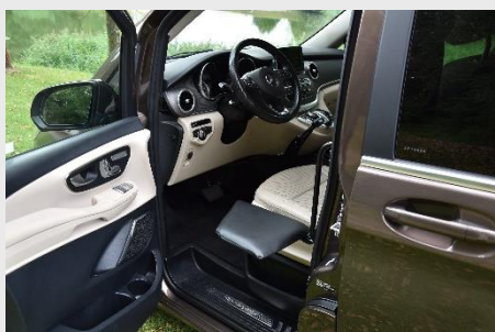
Hohe van Mercedes Benz V, Platte mit Häuten bedeckt.