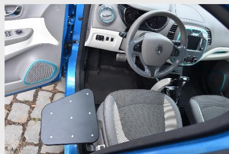
Höherer Personenkraftwagen Renault Captur.